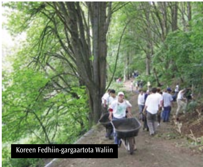
Koreen Fedhiin-gargaartota Waliin

keessa kan 52 turan gara 98ti oli ka'aniru 2004 keessa. Koreen kun guubo kosii kaasu fi kosii sasaabuti hojii sadarkaa oli-ka'a hojjeta, qopphe kamuunity gargaaraa, bishaan kuusame fi seensa paarkii keessa seene qulqulleessa. Inni gara gita namota 10 dabaleera, akkasumas koree waliti makuun si'auma fideera. Koreewan kun kan hardha uffanna adda uffatani kan akka qaxaramtoota paarkotati isaan beeksisu, jireenya paarkotati sima бага nagaan dhuftani dhiyeessu; gaafile fayyadamtota paarki deebisun ni gargaaru.