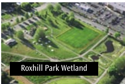
Roxhill Park Wetland

Seena qabeessa headwaters of Longfellow Creek kanati caffee gadjalla kosiin aguugera ijaarsa dhiyoo jiru irra 1960 keessa. 1992 Longfellow Creek Watershed Action Plan kan jedhamu lafoota caffee kana irradebi'ani ijaaru, 1996 Westwood Community Council plaana itti baasu jalqabe. Gibiirichi gargaarsa godhe caffee sadi deebisani ijaaru dhaf, kan lafa caffee acre 3 dabalu fi biqiilaa biyyaa haaraa 40,000 oli , dirre kupphaa haaraa sisteema bishaan obaasuu waliin, iddo bashannana seenamu danda'amu, daandile fi riqichoota, fi iddo waliga'i. Hiri'ottan