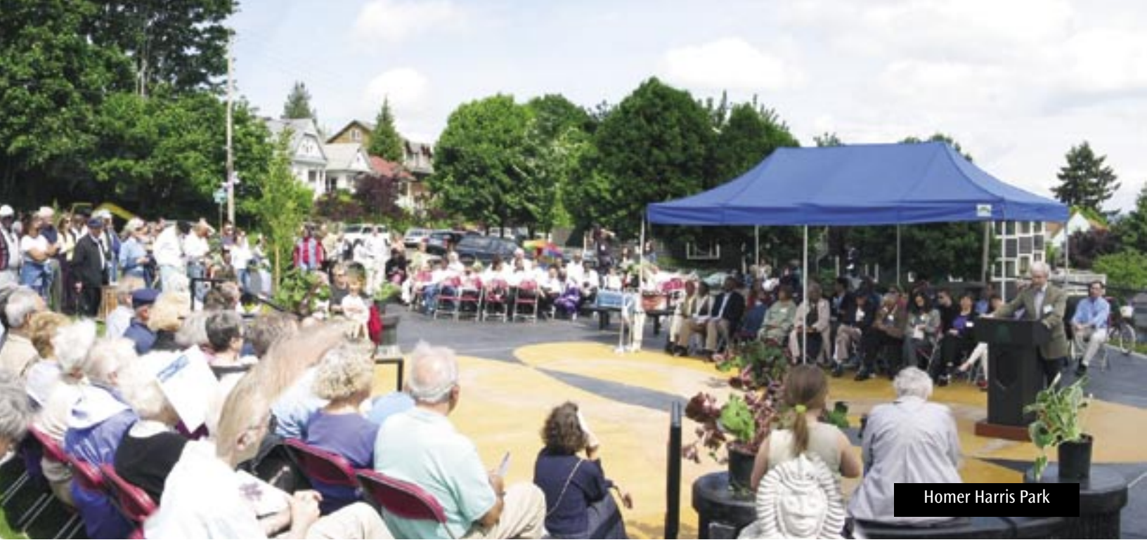
Homer Harris Park