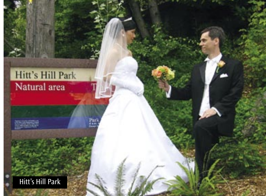
Hitt's Hill Park