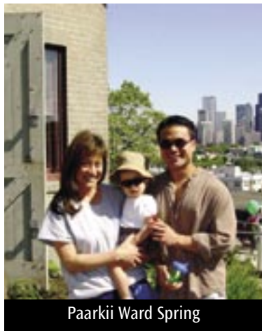
Paarkii Ward Spring

Altokko tokko namooni yeroo godoo Belltown bira darbani waa lama fudhatu; Godoo xixiiqon kun maali hojjetu Belltown walaaka dha? Projeektichi onne ollaa guddataa jiruu kana irra burqe. Godoon kun mallattoo mana 11 keessa warra dhumaa bakka kana irrati 1916 ijaraman, kan staila ijarsa manaa adda 1850-1920 Deny Regrade irra tamsa'ani turani dha. Paarkiin kun kan inni bakka bu'u hojii wagga dheera daddhabii male fi sassabba gargaarsaa hiryottan Belltown P-Patch, ilaachaf artii gasshu, 40-plot P-patch tokko, daandii tokko, fi iddo walga'i tokko. Goodoleen kun, akka turaniit haaromani, barresitoota ofi keessa jiraachisu, Mana Richard Hugo irra, seesota barreesa magaalaa tokko, kan Cpitol Hill irra hunda'e.