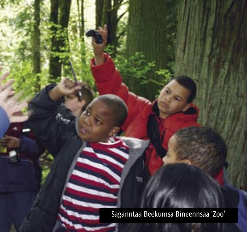
Saganntaa Beekumsa Bineensaa ‘Zoo’