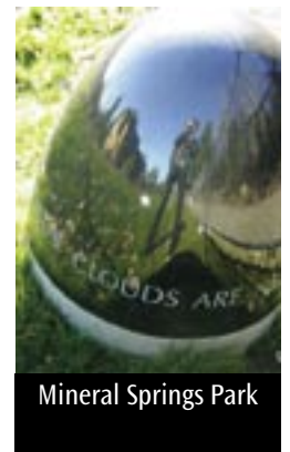
Mineral Springs Park