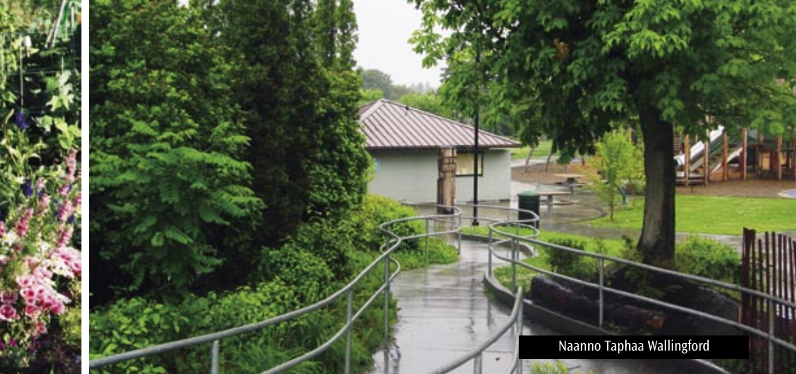
Naanno Taphaa Wallingford