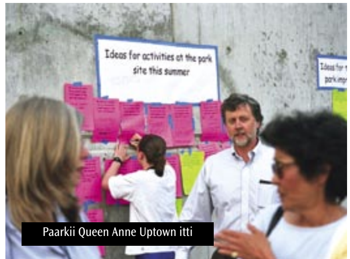
Paarkii Queen Anne Uptown itti

Deemsi kamuuniti paarkii haaraa kana diza'ina gochu deemaa jira. Iddo cimaa magaalaa ta'uf waadaa gala abbaa seenaa Counterbalance itti aane, kan Seattle durii keessati trolleys tabbati irranole gototuuf counterweights fayyadaman.