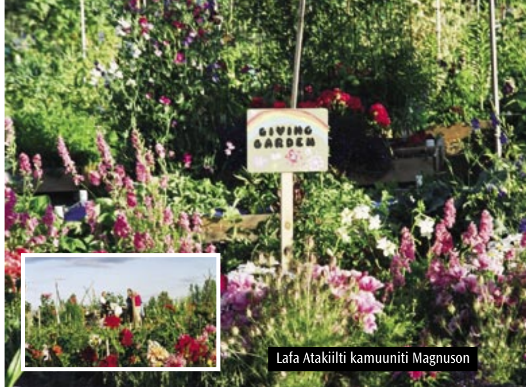
Lafa Atakiilti kamuuniti Magnuson