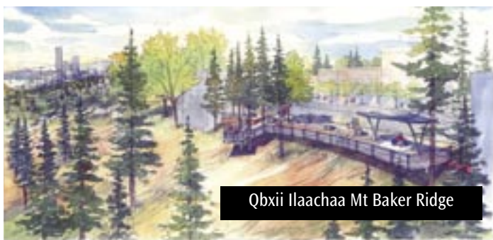
Qbxii Ilaachaa Mt Baker Ridge

ilaalcha umamaa lafaa fi lubuqabeessa irra jiraatani, daangaa umamaa fayyadama lafaa adda-addaf, sagale fi manca'ina qilleensa xiqqeesu, karaa lolaa umamaa, fi sisteema karaa lolaa baasuf fedhii xiqqeesu.