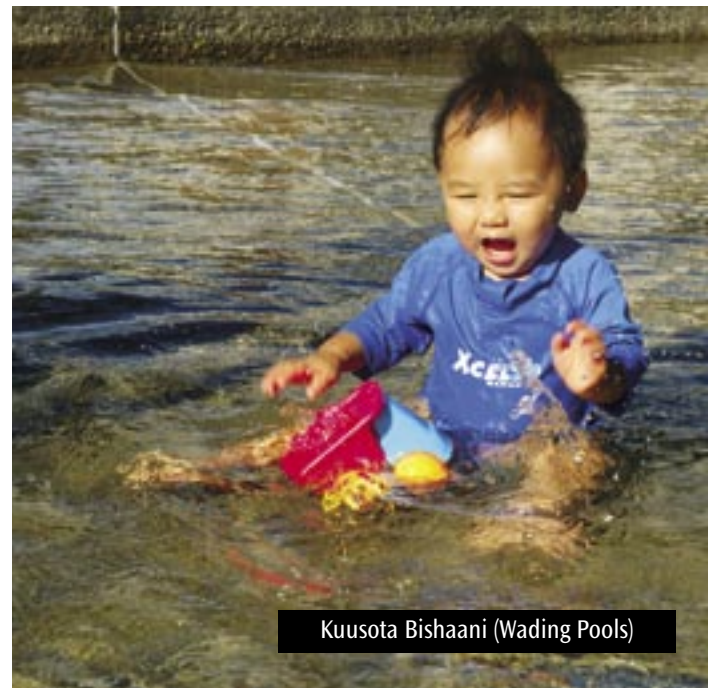
Kuusota Bishaani (Wading Pools)

Gibiiriichi sagantaa baa’e beekamaa ta’e kana guyyan sa’ati fi guyyoota paarkon bona kuusaa bishaani filaman naanno Seattle itti hojjechisan dabala. Waani gammachiisaan, sagantaan nagaqabeesi bonaa kun hojjeettota leenjisa fi sartifikeeta barbaachisaa ta’e State Health Code for Water Recreation Facilities jalaati qabani dhiyeessa. Inni ijoolleen akka nagaa, qalbiqabaato, ummata adda-addaa kan qaqqabu, fi ollan akka waliiti dhufan fi walbeekan godha.