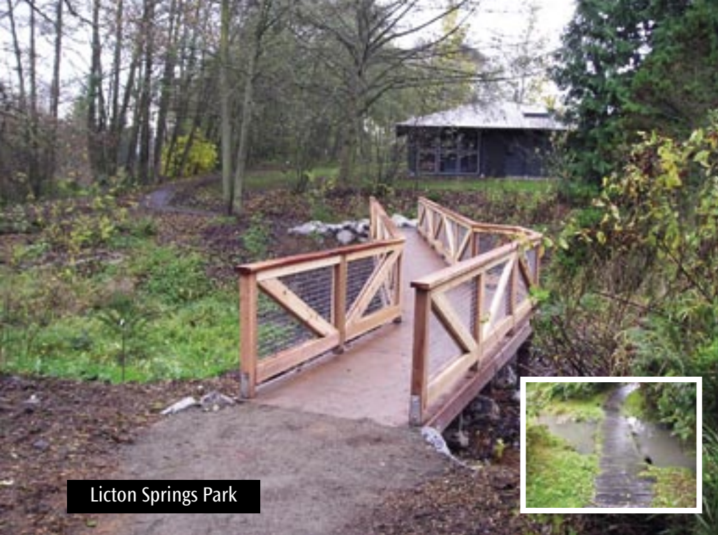
Licton Springs Park