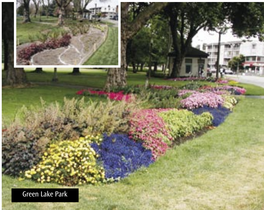
Green Lake Park