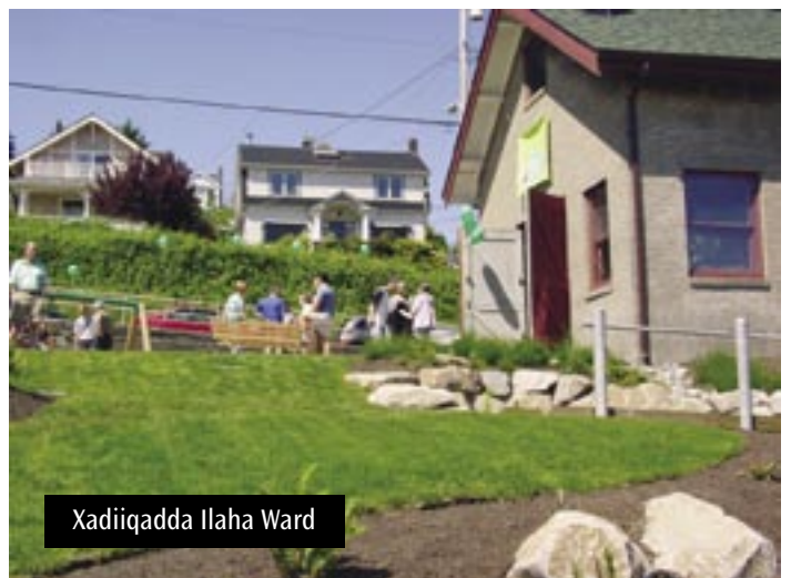
Xadiiqadda Ilaha Ward

Xadiiqaddan yar oo ku taal bartamaha Queen Anne waxaa ay ka tarjumaysaa awoodda ay leedahay tallaabada xaafadi ay wada qaadan. Meel mar ahaan jirtay saldhig biyo ayaa haatan ah meel ay dadka isugu yimaadiin oo wada leh dariiqyo weec weecanaya, bannaan cagaaran, qalab casri ah ee lagu ciyaaro, aqal mashiin leh oo taariikhi ah oo la cusboonaysiiyey kaasoo ay bulshada isugu imaan karto, iyo meel fiican oo magaalada laga daawan karo magaalada hoose iyo sarta