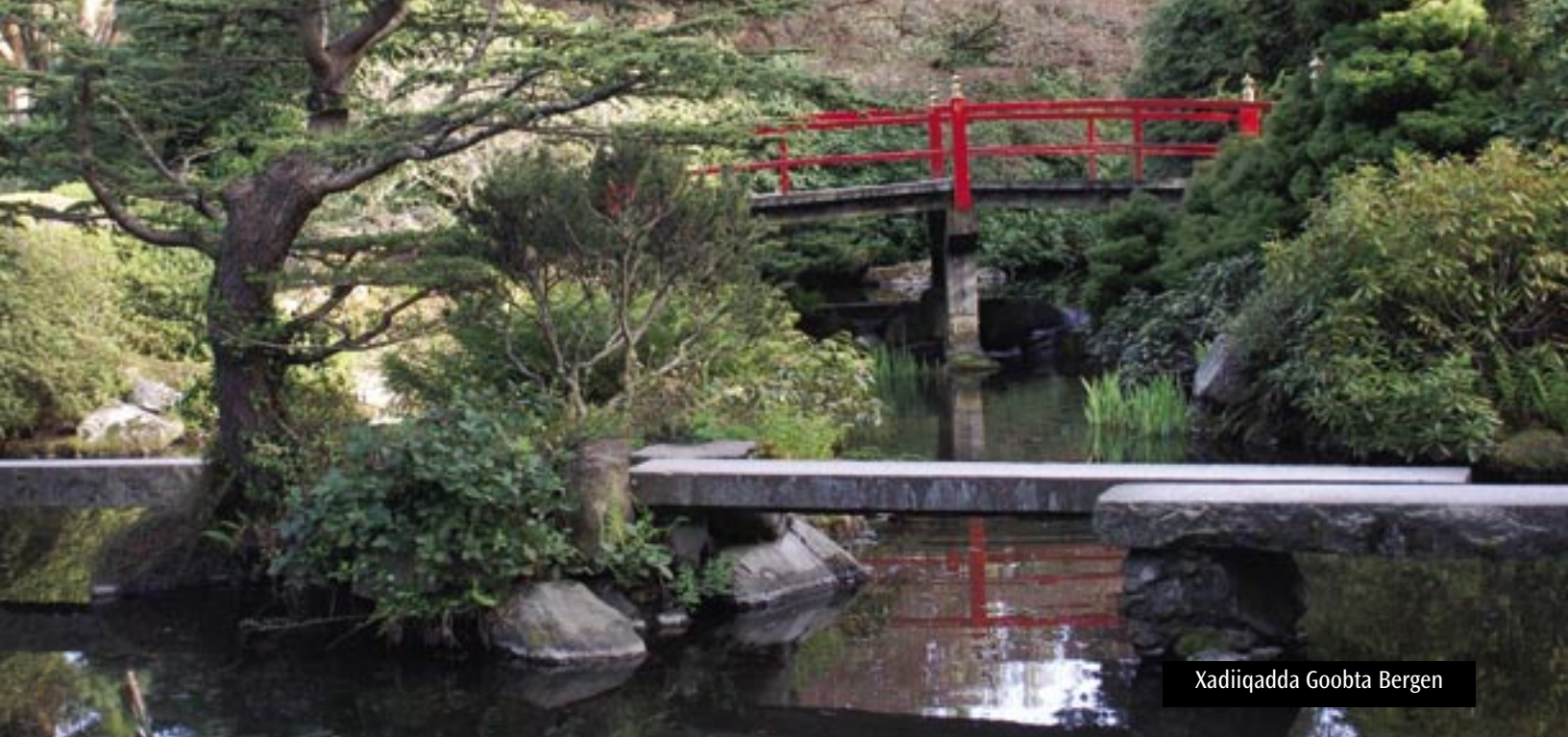
Xadiiqadda Goobta Bergen