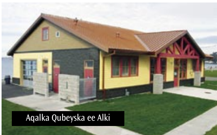
Aqalka Qubeyska ee Alki

Waxaa ay ka mid tahay meelaha taariikhiga ah ee Alki, waxaana ay haraa ka tahay Pavillion-ka ee goobta laga dhisay sannadkii 1911 ee qubeyska, meelaha alaabta la gashto, xarunta jirdhiska, qololka naadiga, baarka qaxwada, iyo daash wax laga daawdo. Qayb ayaa laga dumiyey sannadkii 1955 kaddibna lama isticmaalin illaa farshaxanle-yaasha deegaanka ay billaabeen in ay u isticmaalaan meel ay ku shaqeeyaan iyo fasal wax lagu barto sannadkii 1990-kii. Asaxaabta Aqalka Qubeyska ee Alki waxaa ay soo aruuriyeen deeq lagu cusboonaysiiyo, iyo deeqooyin kale laga helay miisaaniyadda horumarinta iyo Maalgelinta Barbar- Dhigga Deegaanka, ayaa nolol cusub iyo bannaan waxyaabo badan loo isticmaali karo u yeelay dhismaha, meel lagu sameeyo farshaxanka dheriyada dhoobada ah, meel heesaha lagu duubo, suuliyaal oo dibedda laga soo geli karo. Bulshada waxaa ay haatan ku fool leedahay aqal qubeys leh ee ay ku qaadan karaan fasallada jirdhiska, barnaamijyada bey'adda, munaasibooyinka dhallinta, iyo xaffadaha.