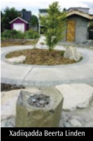
Xadiiqadda Beerta Linden

ee ku yaal galbeedka halka laga soo galo garoonka teeniska, muqaal dhir ee cusub, meel lagu socdo oo kuraas leh, iyo miisa cuntada dibed baxa lagu sameysto, iyo nalal. Garoonka Ciyaarta ee Asaxaabta Wallingford waxaa ay sidoo kale ku sameeyeen galbeedka xuduudda xadiiqadda meel cusub ee ay ku yaalliin geedaha dabiiciga ah.