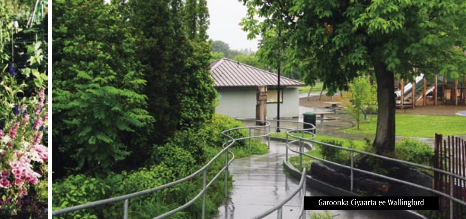
Garoonka Ciyaarta ee Wallingford