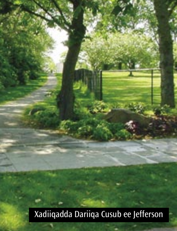
Xadiiqadda Dariiqa Cusub ee Jefferson