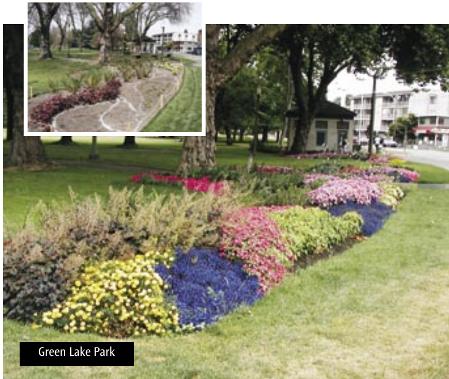
Green Lake Park

Misaaniyadda horumarinta waxaa ay abuurtaa shaqaale taasoo macnaheedu yahay in Xadiiqadaha iyo suuliyada si joogta ah loo nadiifinayo xilliyada iyo wakhtiyada sida aadka ah loo isticmaalo. Tirada