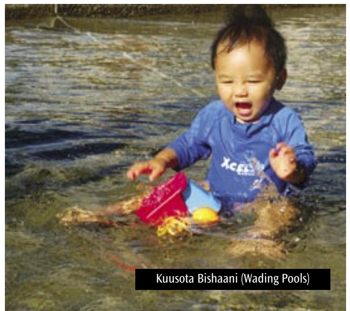
Kuusota Bishaani (Wading Pools)

Misaaniyadda waxaa ay taageeraysaa barnaamijkan caanka ah ee xagaaga loogu talagalay iyadoo maalgelinaysa kordhinta saacadaha maalintii iyo tirada maalmaha xagaaga ay Xadiiqadaha ka furan yihiin barkadaha biyaha ee Seattle. Barnaamijkan badbaadada leh ee xagaaga waxaa uu siinayaa shaqaalaha soo dhammeystay tababarka iyo shuruudaha shahaadada sida ku cad Xeerka Caafimaadka Gobolka ee Xarumaha Madadaalada Biyaha. Carruurta ayuu qaboojinayaa islamarkaana badbaadinayaa, biyaha ayuu kaydinayaa, waxaana uu gaarayaa dad kala duwan iyadoo uu ka saacidayo dadka deegaanka in ay kulmaan oo ay isbartaan.