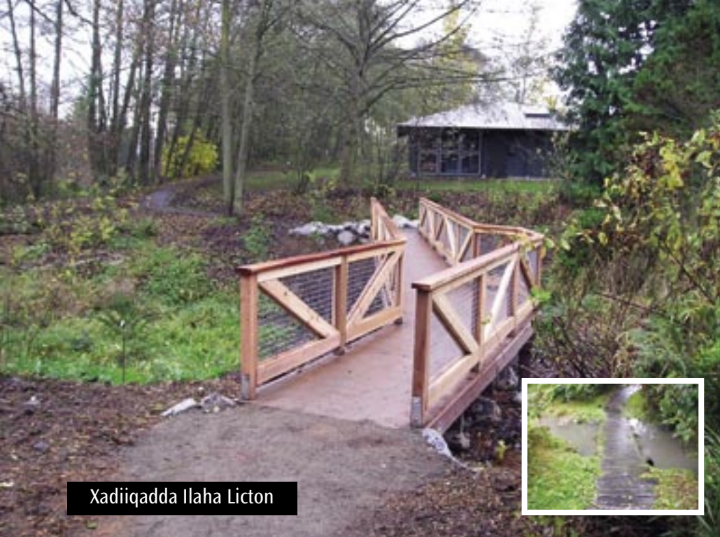
Xadiiqadda Ilaha Licton