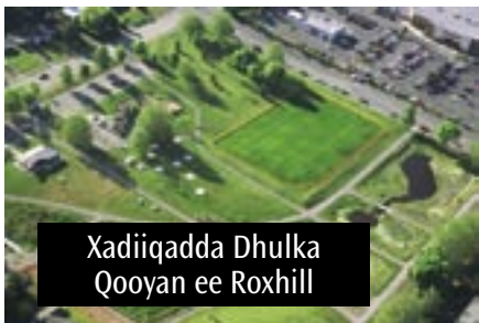
Xadiiqadda Dhulka Qooyan ee Roxhill

Meeshan taariikhiga ah ee dhulka qooyan ka tirsan Webiga-yar ee Longfellow dhulka hoose ee qooyan ee dhirta leh waxaa ka buuxay wasakh kaga timid dhismo ku