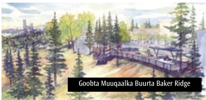
Goobta Muuqaalka Buurta Baker Ridge

ee isticmaalka dhulka, dhimista dhawaaqa iyo hawada wasakhaysan, biyo mar dabiici ah, iyo baahida yar ee dhismaha qaabka biyaha qaada.