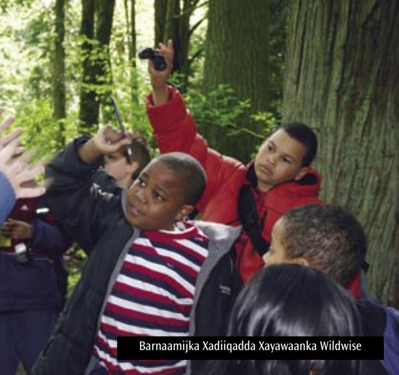
Barnaamijka Xadiiqadda Xayawaanka Wildwise