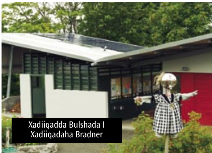
Xadiiqadda Bulshada I Xadiiqadaha Bradner

Xadiiqadda cusub ee la cusboonaysiiyey, oo haatan ah meel qorraxda u furan ee ay dadka isugu yimaadiin, waxaa ay qabtaa tabakaayo, kuraas dheer ee lagu fadhiisto, muqaalka dhirta ee cusub, koronto, iyo farshaxan cusub. Dusha meesha ay dadka isugu yimaadiin, dhagaxyo garaaniito (dhadhaab) ee tilmaan u ah dalalka Iskaandineefiyaanka kaasoo muujinaya naqshad mid kasta u gaar ah, waxaana uu mid sitaa macluumaadka taariikhiga ah ee Norway. Buugga Jen Dixon “Marqaatiga Geedaha” waxaa uu ku soo xasuusinayaa noloshu dabiiciga ee Iskaandineefiyaanka iyo taariikhda Ballard.