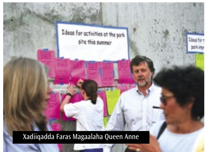
Xadiiqadda Faras Magaalaha Queen Anne

Hawl bulshadeed ayaa socota ee lagu naqshadeynayo xadiiqaddan cusub. Waxaa ay ballan qaadaysaa in ay noqoto bannaan khibrad iyo ilbaxnimo sare leh oo ku ag taal goobta taariikhiga ah ee Counterbalance, oo waagii hore ahaan jirtay meel lagu dheel tiro miisaanka gaariga korontada ku socda marka uu buurta fuulayo.