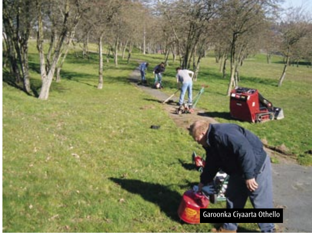
Garoonka Ciyaarta Othello