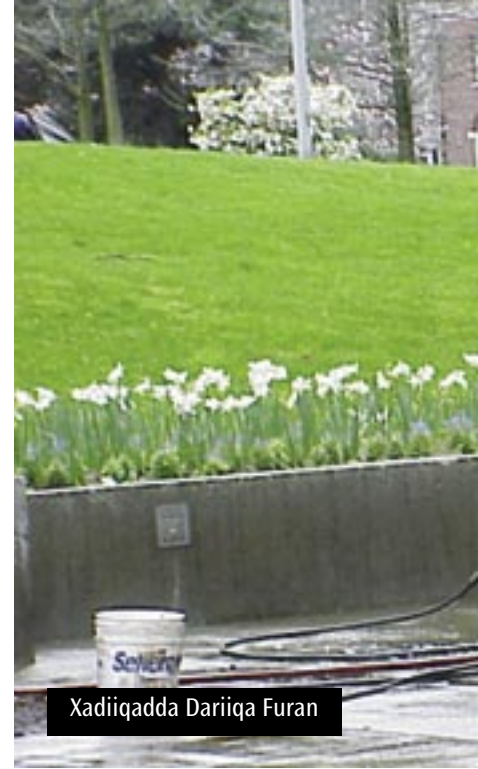
Xadiiqadda Dariiqa Furan