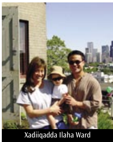
Xadiiqadda Ilaha Ward

Mararka qaarkood dadka socod ku mara Belltown Cottages waxaa ay is waydiiyaan: maxaa uu aqalkani ka suubinayaa Belltown? Mashruuca waxaa uu ka soo if-baxay bartamaha xaafaddan ballaaranaysa. Aqallada bartilmaameedka ah waxaa ay ka mid yihiin 11-ka aqal ee goobta ku yaal, oo la dhisay sannadkii 1916, kuwaasoo matalaya noocyada aqallada Denny Regrade ee laga soo billaabo 1850-kii illaa 1920-kii. Xadiiqadda waxaa ay matalaysaa sanooyin hawlo aan laga dalin iyo deeq aruurin laga helay Asaxaabta Belltown P-Patch (Friends of Belltown P-Patch), waxaana ay qabtaa qalab farshaxan, dhul 40 boos ah, dariiqyo, iyo bannaan la isugu yimaado. Aqallada, oo sidoodii hore laga dhigay, waxaa ay hoy u yihiin qoraayaasha laga billaabo aqalka Richard Hugo, meel ay yimaadiin qoraayaasha magaalada ee jooga Capitol Hill.