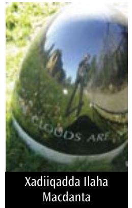
Xadiiqadda Ilaha Macdanta