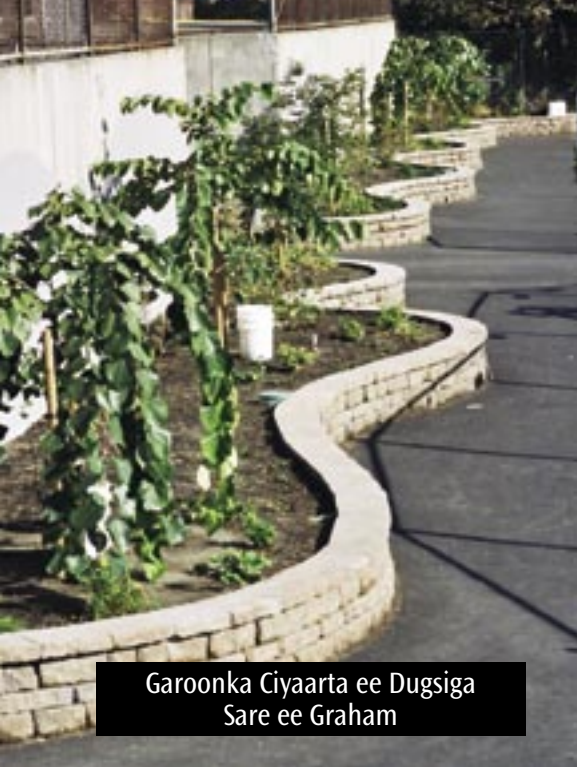
Garoonka Ciyaarta ee Dugsiga Sare ee Graham