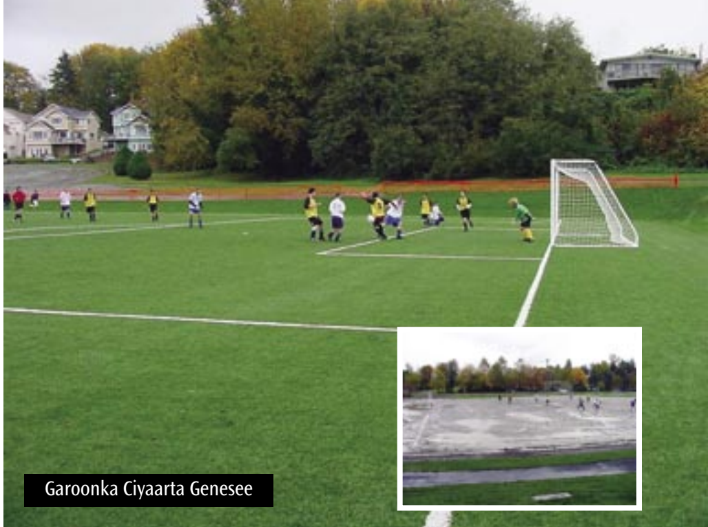
Garoonka Ciyaarta Genesee