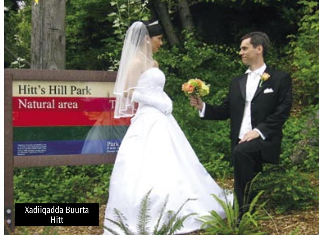
Xadiiqadda Buurta Hitt