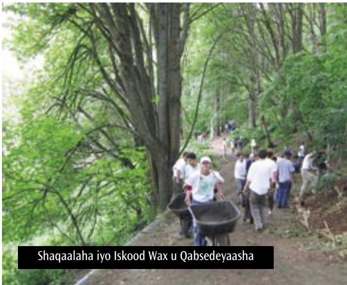
Shaqaalaha iyo Iskood Wax u Qabsedeyaasha

Tilmaan bixiyaha cusub ee Tilmaanta Baaritaanka Xarunta (Facility Inspection Manual) waxaa uu leeyahay qaab lagu cabbiro nadaafadda dhismooyinka iyo tilmaanta waxyaabaha shaqaalaha laga doonayo, iyadoo joogtaanka shaqaalahani ay u fasaxayso shaqaalaha madadaalada in ay xoogga saaraan barnaamijyada iyo adeegga macaamilka.