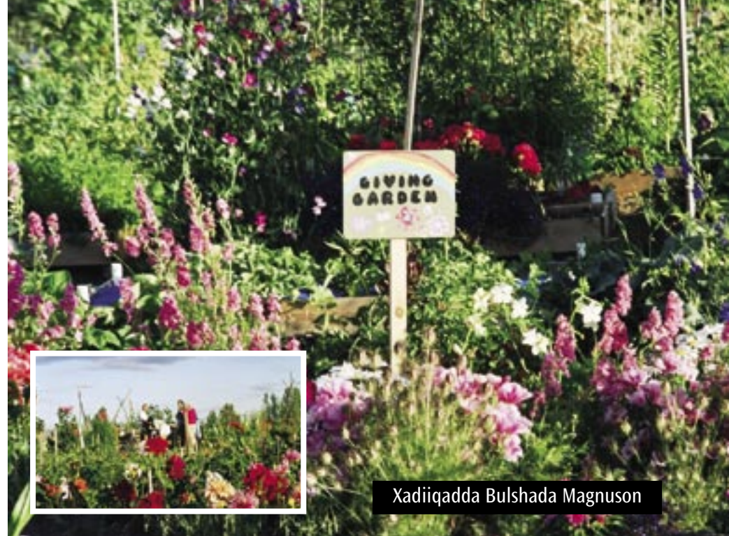
Xadiiqadda Bulshada Magnuson