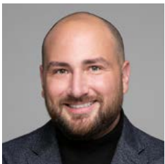
ኮሚሽነር ኢጄ ጁአራዝ (EJ Juárez) (እሱ/እሱ) ለዋሽንግተን የተፈጥሮ ሃብት መምሪያ የፍትሃዊነት እና የአካባቢ ፍትህ ዳይሬክተር ናቸው።