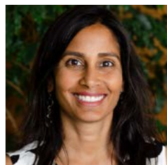
ኮሚሽነር ኒኤሊማ ሻህ (Neelima Shah) (እሷ/እሷ) ሲያትልን መሠረት ባደረገ የቡሊት ፋውንዴሽን የከፍተኛ ፕሮግራም አፈሰር ናቸው።