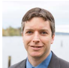
ኮሚሽነር ሮሪ ኦሱሊቫን (Rory O'Sullivan) (እሱ/እሱ) በአሁኑ ጊዜ ከአስተዳደር ችሎት ቢሮ ጋር እንደ የአስተዳደር ህግ ዳኛ ሆነው ያገለግላሉ።