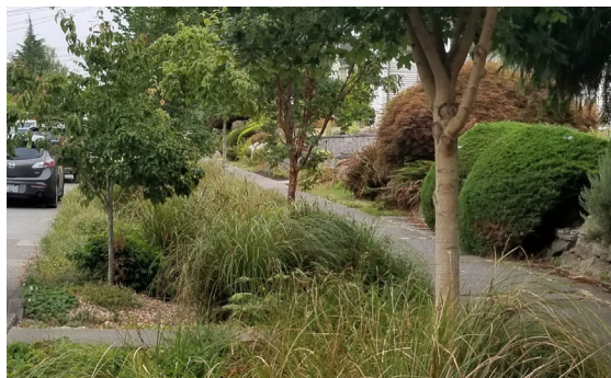
ዝተወደአ ተፈጥሮአዊ ስርዓት መወገዲ ፈሳሲ ኣብ ሳይና መንበሪ ኣባይቲ።