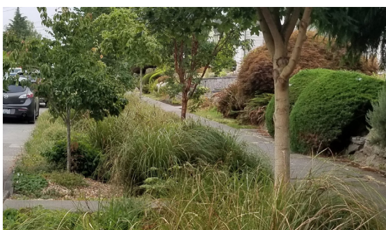
Hệ thống thoát nước tự nhiên đã hoàn thiện trên đường khu dân cư.